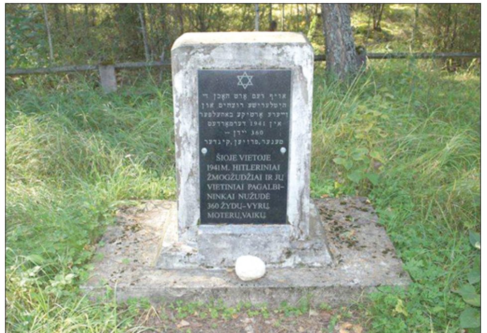
Žydų sušaudymo vieta Senojeje Varėnoje

„Atminties kelio 1941–2021“ formatas išlieka tradicinis: kaip ir ankstesniais metais minėjimo renginių dalyviai kviečiami susirinkti miestų ir miestelių centrinėse dalyse (kur anksčiau gyveno žydai) ir iš čia pradėti eisenas į jų nužudymo vietas tais pačiais keliais, kuriais buvo varomos Holokausto aukos. Minėjimų dalyviai galėtų atsinešti akmenėlių su ant jų užrašytais čia gyvenusių žydų vardais – tai ir pagarba istoriškai susiklosčiusiai žydų tradicijai ir kapines nešti akmenėlius, ir holokausto aukų įsameninimas. Žudynių vietose vykstančiuose minėjimuose kviečiama išarti šiuos vardus ir prikelti iš nebūties atskirų šeimų ar iškiliausių to krašto