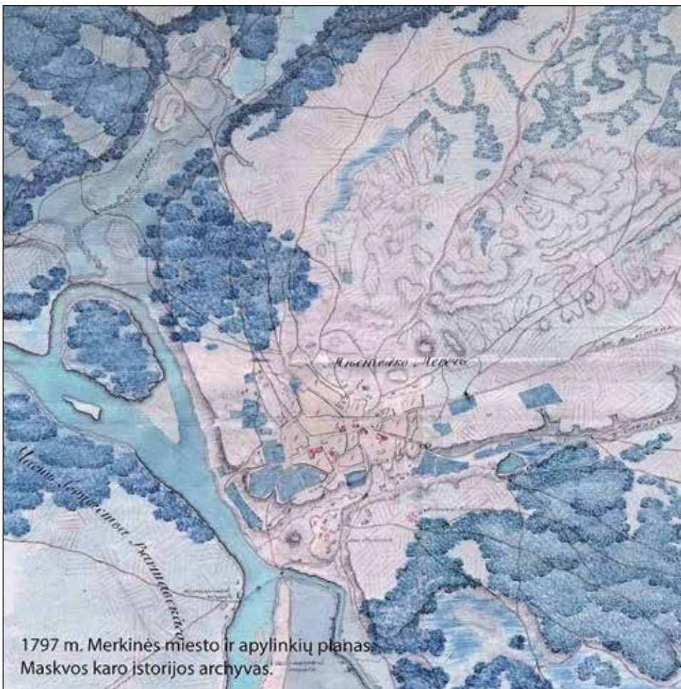
1797 m. Merkinės miesto ir apylinkių planas. Maskvos karo istorijos archyvas.

po to, kai 1569 metais Lietuvos ir Lenkijos karalius Žygimantas Augustas suteikė Merkinei Magdeburgo miesto teises ir buvo nustatytos miesto žemių ribos. Tuomet, 1579 metais, prie pagrindinių kelių į Merkinę buvo pastatyti mūriniai jos žemių ribas ženklinantys stulpai, kurių, kaip spėjama, stovėjo bent keturi.