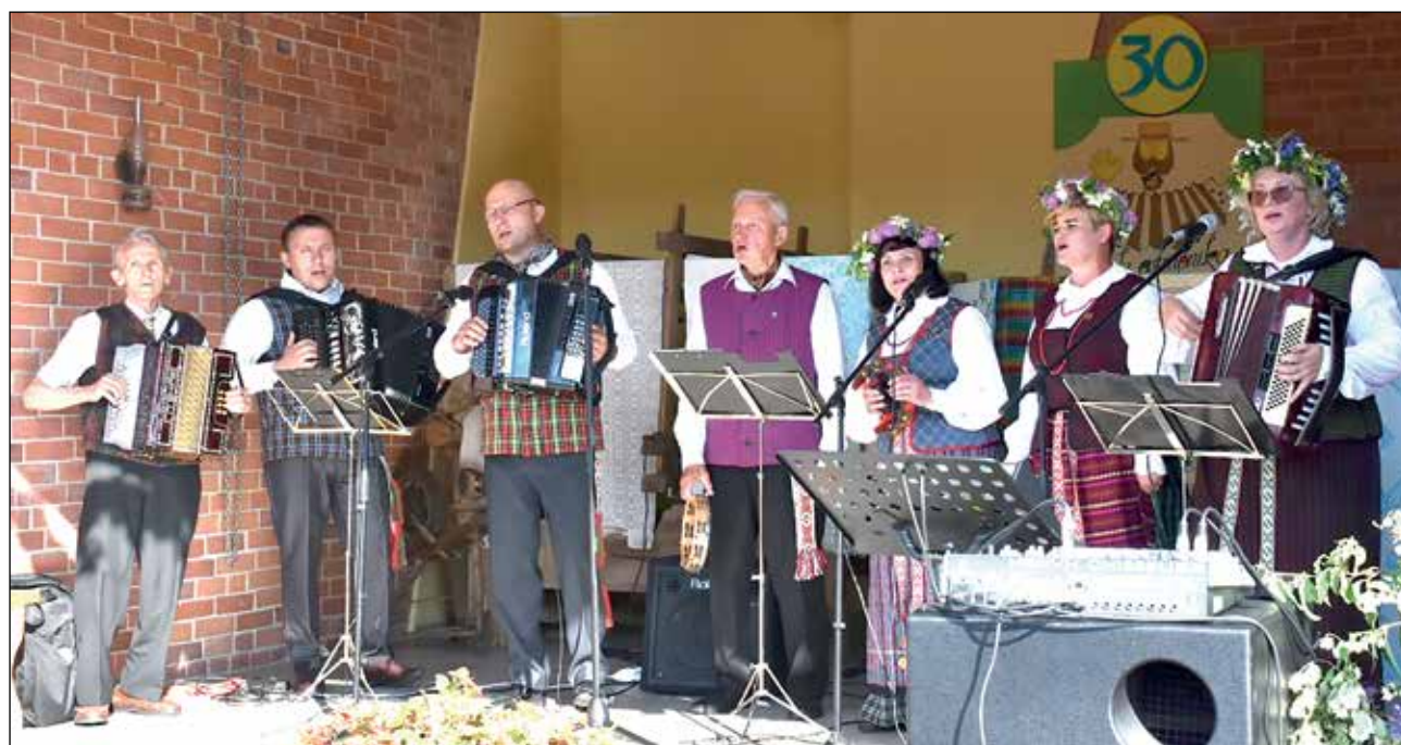
Perlojos liaudiškos muzikos kapela