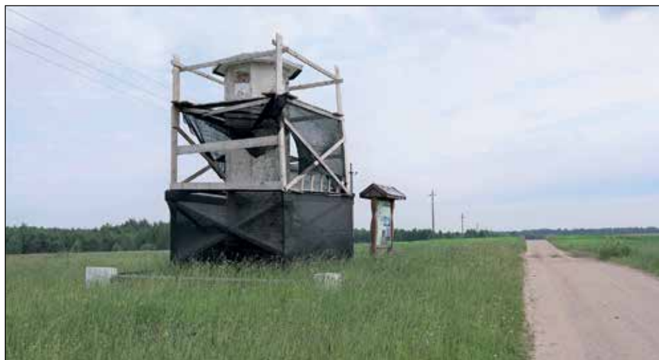
Vienas iš dviejų išlikusių istorinių Merkinės miesto riboženklų