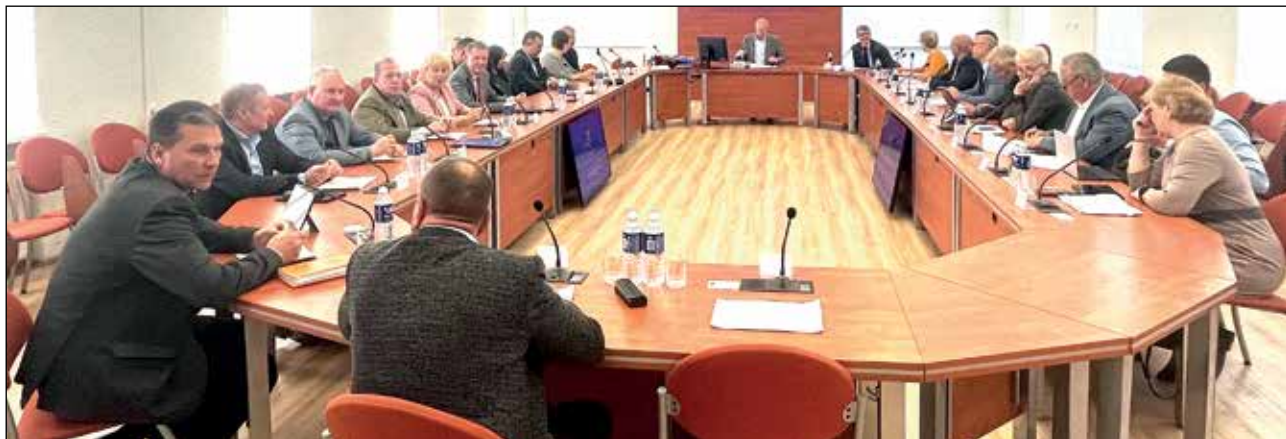
Gegužės 24 dienos rajono tarybos posėdis atnaujintoje savivaldybės didžiojoje salėje